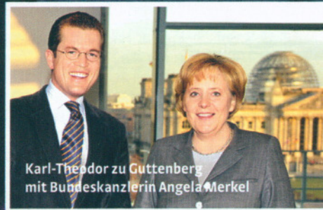
Karl-Theodor zu Guttenberg mit Bundeskanzlerin Angela Merkel