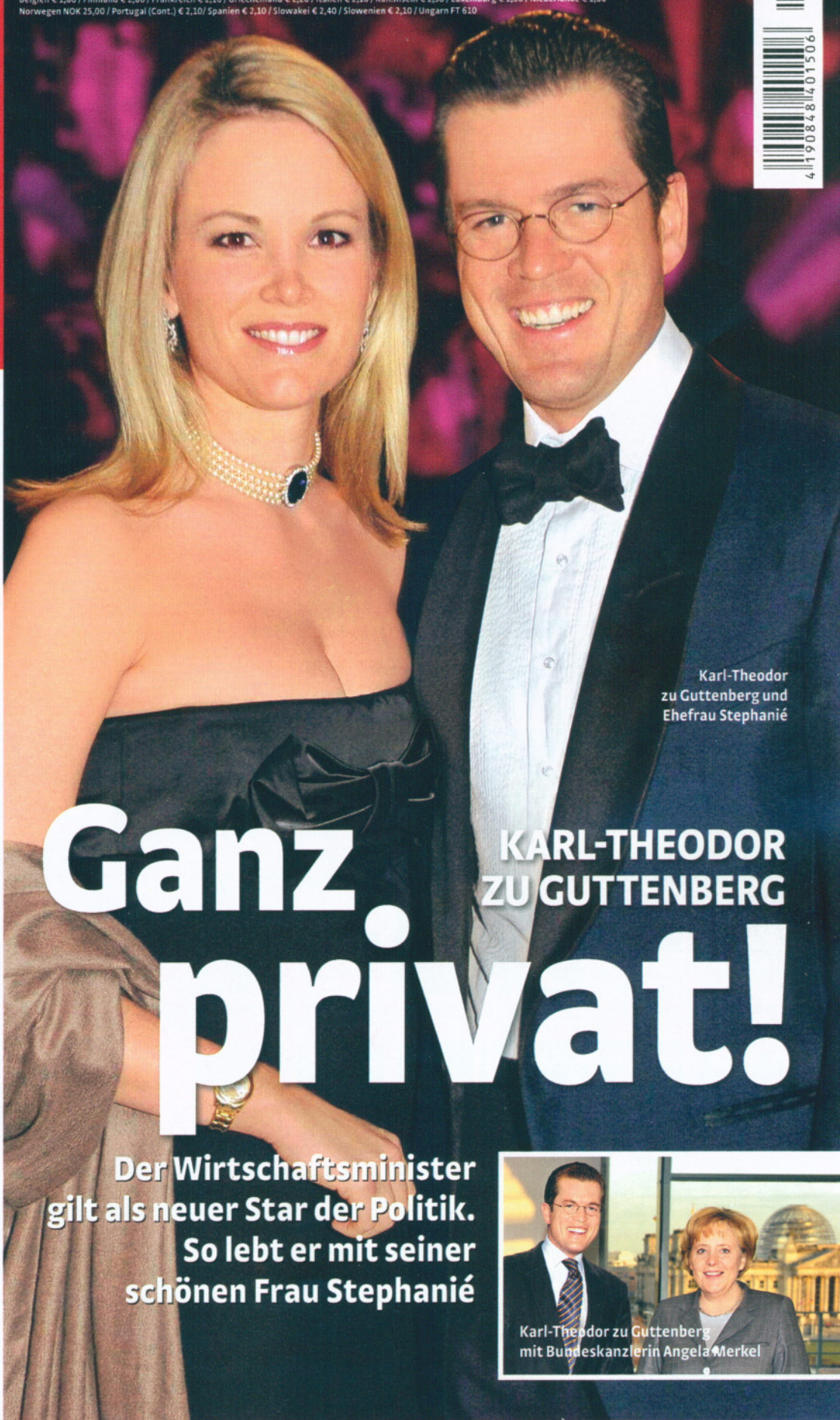
Karl-Theodor zu Guttenberg und Ehefrau Stephanié