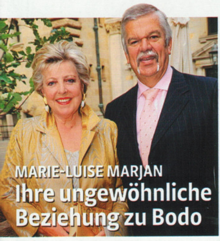
MARIE-LUISE MARJAN Ihre ungewöhnliche Beziehung zu Bodo