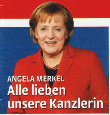
ANGELA MERKEL Alle lieben unsere Kanzlerin