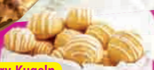
Cherry-Kugeln S. 22/23